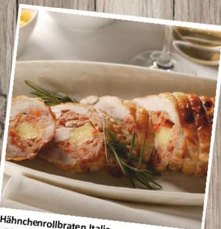
Hähnchenrollbraten Italia mit Tomate-Mozzarella-Füllung Gewicht: 1250 g/ST Euro 13,50/Stück