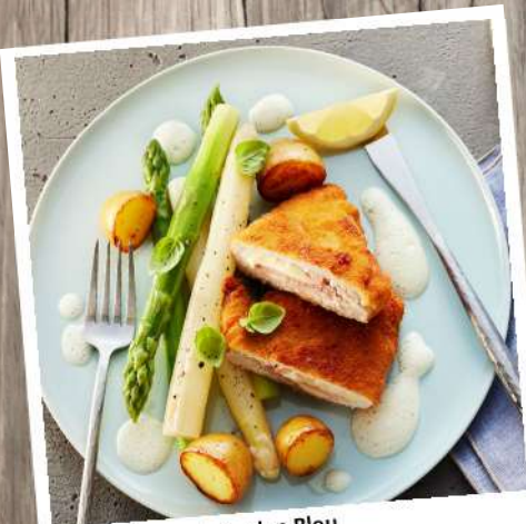
Poulardenbrust Cordon Bleu mit Schinken und Käse, paniert, roh Gewicht: 190 g, 4 ST/Beutel Euro 10,20/Beutel