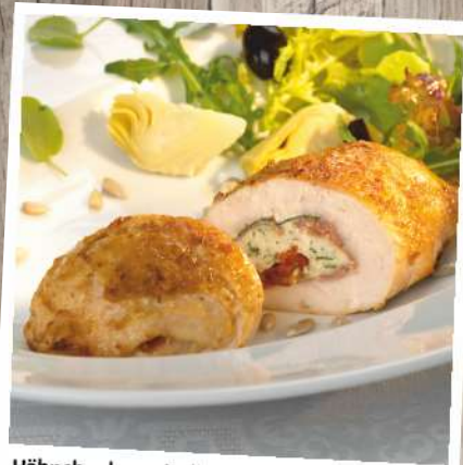
Hähnchenbrust Italia mit Frischkäse, Ital. Landschinken und getrockneten Tomaten Gewicht: 180 g, 4 ST/Beutel Euro 10,70/Beutel