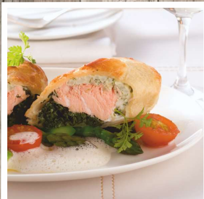
Lachs im Blätterteig mit Blattspinat und Champignon-Reisfüllung Gewicht: 200 g/ST, 4 ST/Beutel Euro 25,00/Beutel