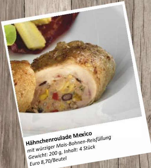
Hähnchenroulade Mexico mit würziger Mais-Bohnen-Reisfüllung Gewicht: 200 g, Inhalt: 4 Stück Euro 8,70/Beutel