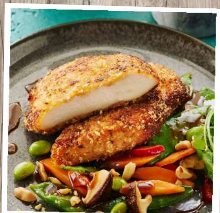
Hähnchenbrustschnitzel Wiener Art paniert, roh Gewicht: 160-170 g/ST, 4 ST/Beutel Euro 8,70/Beutel