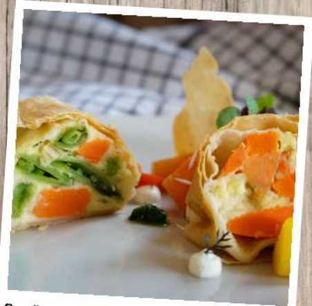
Gemüsestrudel Gewicht: 200 g/ST, 4 ST/Beutel Euro 4,40/Beutel