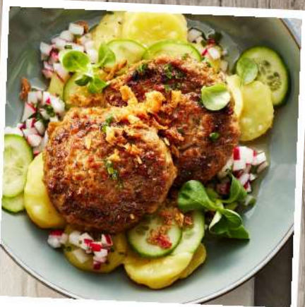
Kalbfleischpflanzerl auf Gusspfanne angebraten Gewicht: 80 g/ST, 4 ST/Beutel Euro 6,40/Beutel