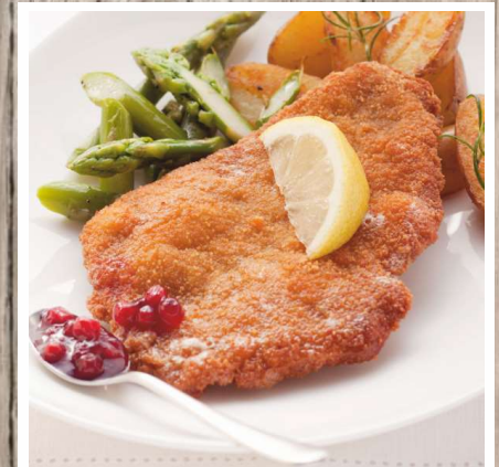
Schweinerückenschnitzel paniert, vorfrittiert Gewicht: 170 g, 4 Stück/Beutel Euro 9,60/Beutel