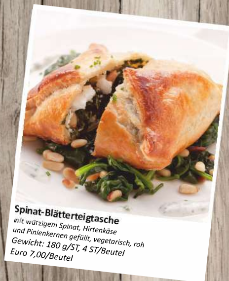
Spinat-Blätterteigtasche mit würzigem Spinat, Hirtenkäse und Pinienkernen gefüllt, vegetarisch, roh Gewicht: 180 g/ST, 4 ST/Beutel Euro 7,00/Beutel

Bitte sprechen Sie uns auf unsere Zusatzangebote für Ostern und Weihnachten an!