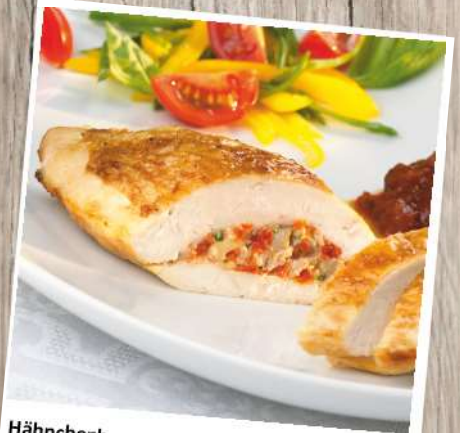
Hähnchenbrust Marengo mit Champignons, Tomaten und Kräutern Gewicht: 180 g/ST, 4 ST/Beutel Euro 10,20/Beutel