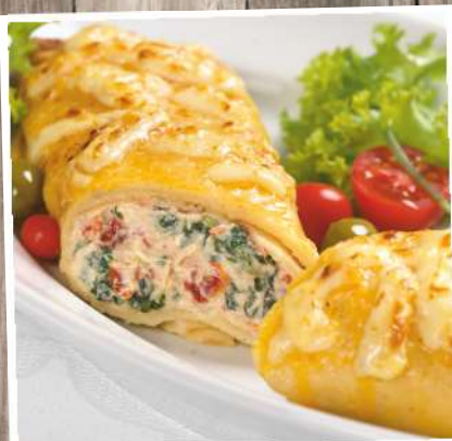
Crespelle Italienische Art Gefüllter Pfannkuchen mit Ricotta, Spinat und getrockneten Tomaten, vegetarisch Gewicht: 200 g/ST, 4 ST/Beutel Euro 7,50/Beutel