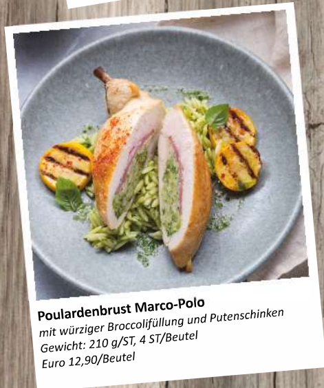
Pouardenbrust Marco-Polo mit würziger Broccolifüllung und Putenschnitten Gewicht: 210 g/ST, 4 ST/Beutel Euro 12,90/Beutel