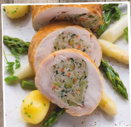
Hähnchenrollbraten Gärtnerin mit feiner Gemüsefüllung Gewicht: 1250 g/ST Euro 12,90/Stück