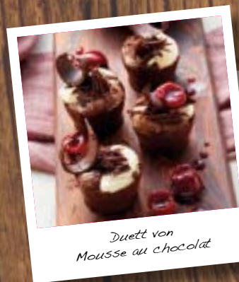
Duett von Mousse au chocolat