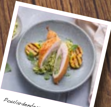
Poulardenbrust Marco Polo

Stückgewicht: 180 g/ST 4 ST/Beutel Preis: 7,80 €/Beutel