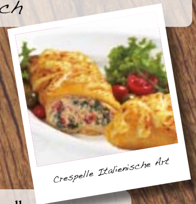
Crespelle Italienische Art

Stückgewicht: 180 g/ST 4 ST/Beutel Preis: 5,90 €/Beutel